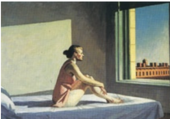
HOPPER. Sol matinal

Por fin, el lobo ha desaparecido. Abuela y nieta se han salvado. El peligro se ha ido y se quedan solas. Llega la tranquilidad.