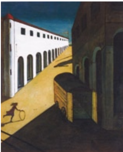
DE CHIRICO. Misterio de una calle