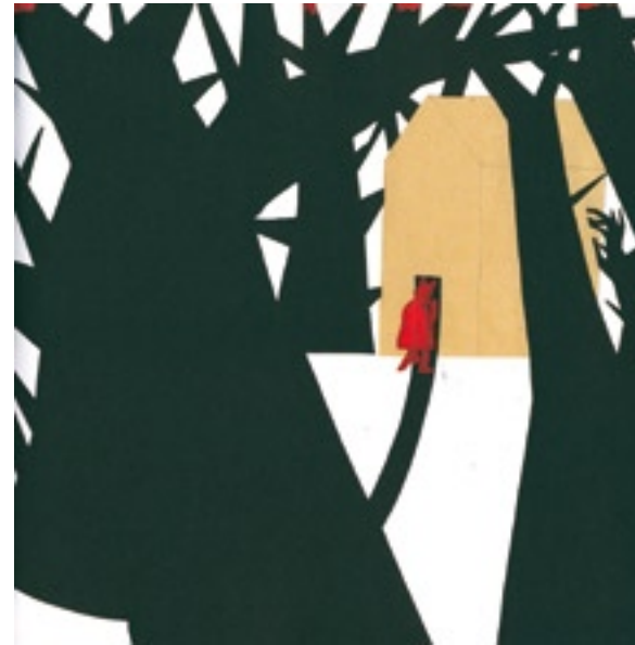
(5) CARRER, Chiara. La bambina y el lupo. Milán: Topipittori 2005.