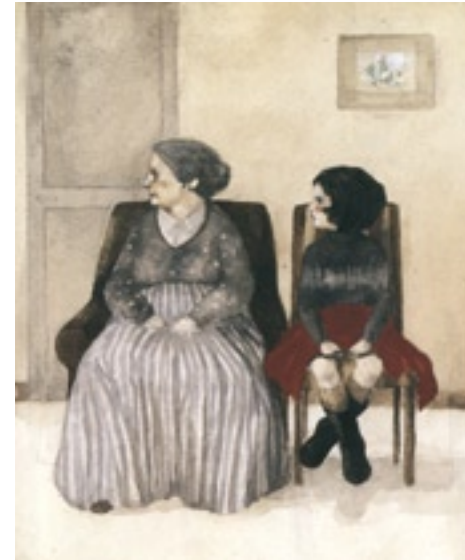
(10) SEGOVIA, Carmen. Caperucita Roja. Madrid: Anaya, 2003.