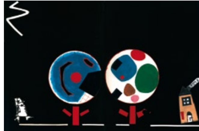
(9) PACOVSKA, Kvetta. Caperucita Roja. Madrid: Kókinos, 2008.